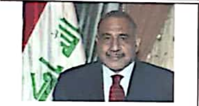
آقای عادل عبدالمهدی