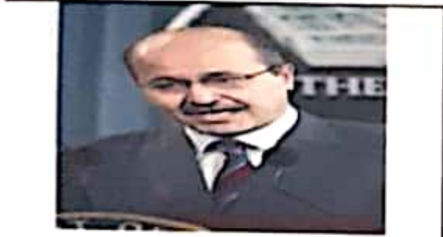
آقای برهم صالح