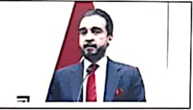
آقای محمد حلبوسی